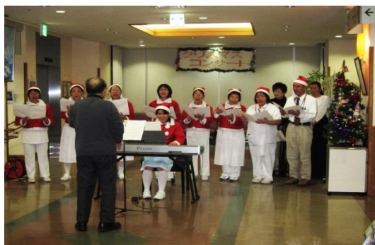
クリスマスコンサート