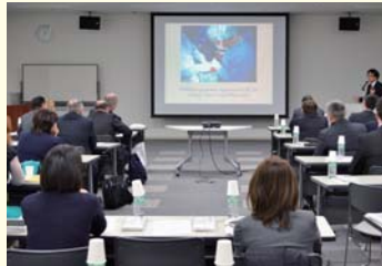
▲金丸副院長による講演の様子