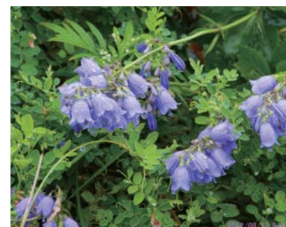
趣味で撮影されたツリガネニンジン